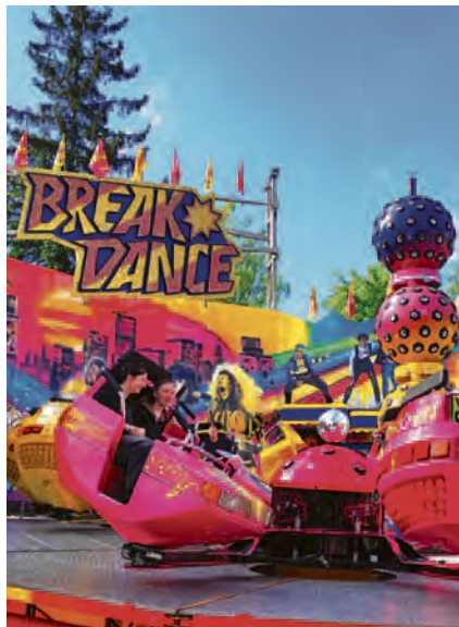
Ein Wochenende voll auf Anschlag: Den sprichwörtlichen Satz „Des einen Freud, des andern...“ lassen wir im Angesicht des erlebnisreichen Stadtfestwochenendes lieber unvollendet und bedanken uns stattdessen herzlich für den