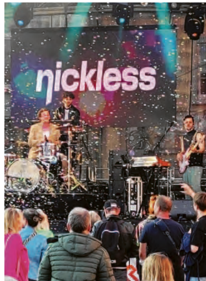
das frühlingshaft-warme Wetter sicher optimal entgegen, nach der Anzahl der gesichteten Eistüten zu urteilen, müsste ohnehin schon Sommer gewesen sein. „Hut ab“ vor dem Durchhaltevermögen all jener Dance-Begeisterten, die sowohl