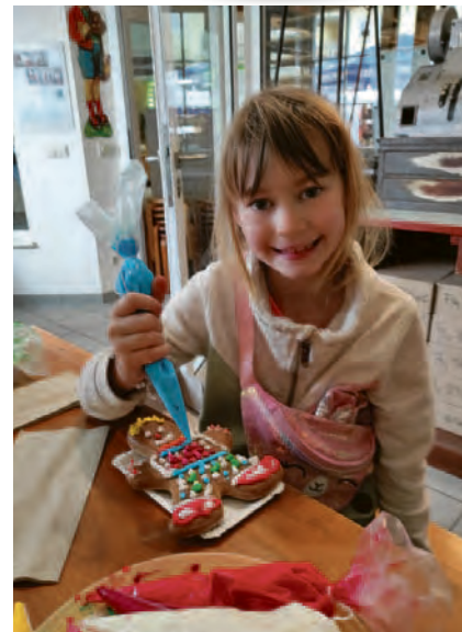
am Freitag bei „The Oldschool Legends Brothers Inc. + Admirals“ sowie am Sonntag bei „Gestört aber geil“ auf dem Ziegenbalg- bzw. Marktplatz zu sehen waren!