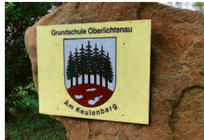
2027/2028 erfolgt für alle schulpflichtigen Kinder am 31. August 2026 zwischen 14 und 16 Uhr in der Grundschule Oberlichtenau, Keulenbergstr. 6, 01896 Pulsnitz.